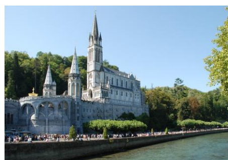
La basilique et le Gave