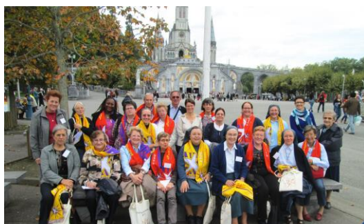
Le groupe méricien