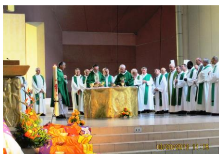
Célébration de clôture