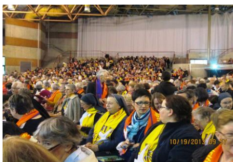
Dans l'église ste Bernadette

« Une même foi nous anime aujourd'hui, Familles rassemblées au nom du Seigneur, Un même amour nous envoie aujourd'hui, Pour vivre ta mission, Seigneur. »