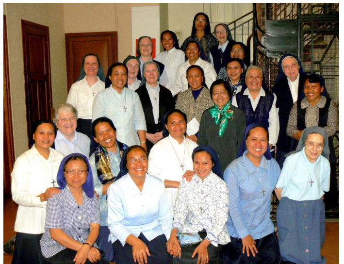
Ursulines indonésiennes et françaises