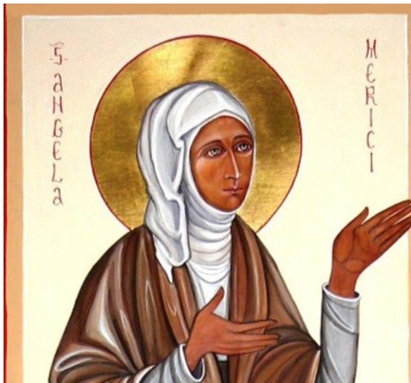
Détail de l'icône réalisée par Sr Francesca Vilio, Mericianum