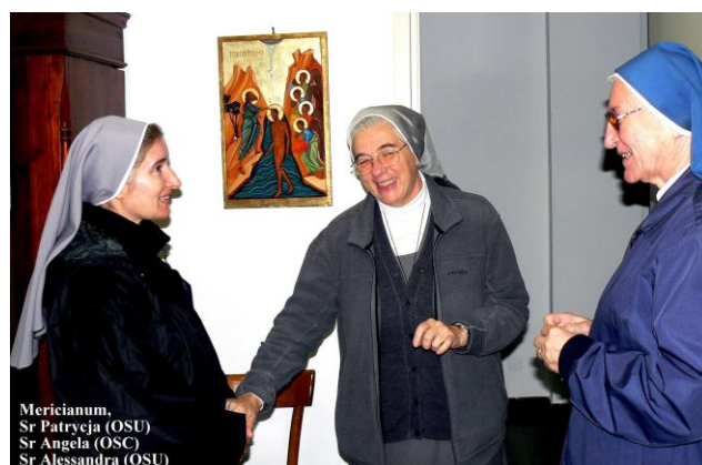
Visite au Mericianum