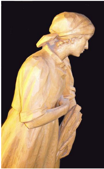
Angèle, dans l'église de Desenzano