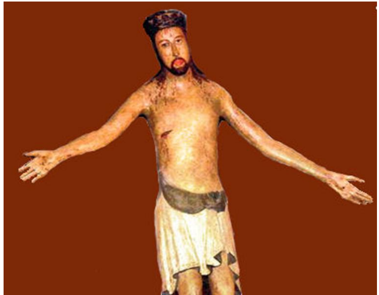
Christ de la chapelle des Ursulines à Capriolo, XIIIe