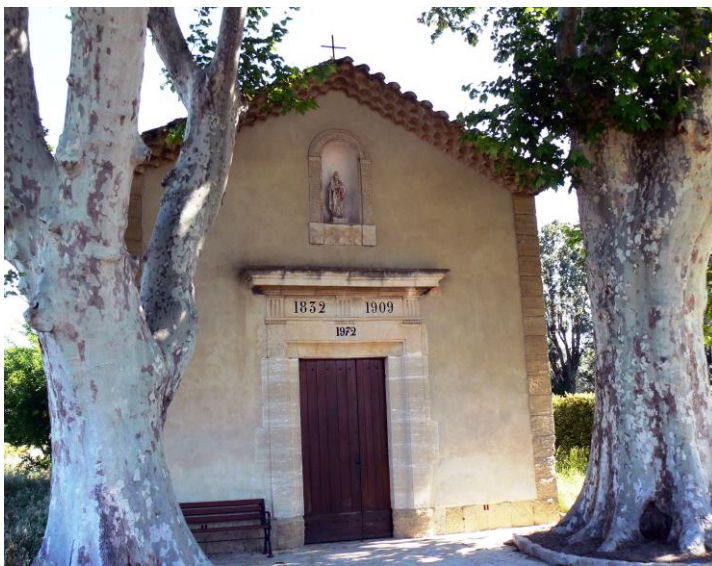
La chapelle dans le champ Laplane, à Gabet

Les corps des martyres furent jetés dans des fosses communes, dans le champ Laplane (à Gabet), situé à 4 kilomètres de la ville, au bord de l'Aygues, et une chapelle y fut bâtie en 1832.