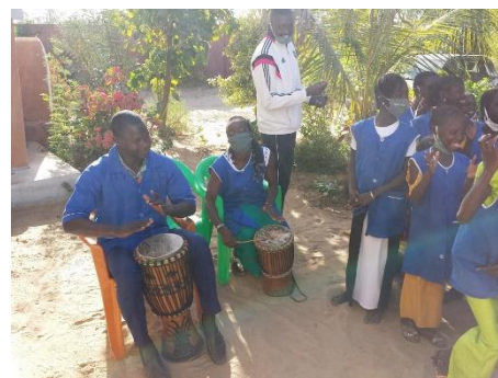
Des enseignants au tam-tam

La pandémie de la Covid 19 a aussi affecté notre pays. Nous avons parcouru ensemble un temps d'épreuve, qui dure encore. Nous avons connu des moments difficiles. Les enseignements ont été interrompus pendant 7 mois l'année passée. Les enseignants ont donné des séries d'exercices chaque semaine, pendant quelques mois, pour aider les élèves à se maintenir. Dans les villages il n'y a pas la possibilité de suivre des cours par internet... beaucoup n'ont pas encore d'électricité. Vous pouvez imaginer que la reprise a été très dure. La plupart des enfants avaient tout oublié ou presque.