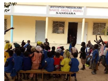
Mardi gras 2021

Les conséquences de la Covid 19 touchent de plein fouet beaucoup de familles autour de nous et notamment celles de nos élèves. Certains n'ont pas encore pu payer ce qu'elles devaient à l'Ecole pour la scolarité, les fournitures ou la cantine. Pour beaucoup, c'est un temps difficile. Certains ont perdu leur travail. Le marché hebdomadaire de Sandiara, qui est un facteur économique important, a été fermé pendant beaucoup de mois. Vous imaginez le manque de revenus de ceux qui y vendent leurs légumes, œufs, chèvres... ou qui offrent le transport par charrette et autres.