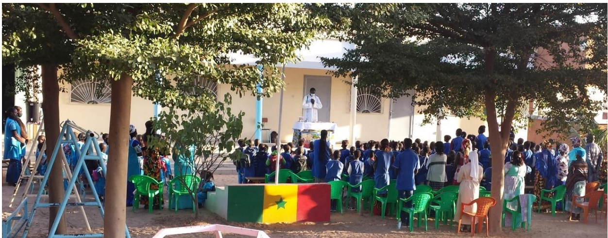
Célébration de la Fête de Sainte Angèle, 26 janvier 2021