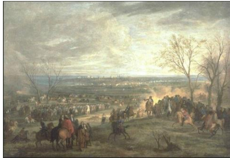
Van Der Meulen Prise de Valenciennes par Louis XIV.

En 1656 les Français assiégèrent Valenciennes qui faisait partie des Pays Bas espagnols. Du 30/6 au 15/7, des pentes du Rôleur les Français bombardèrent la ville, surtout le quartier de la porte de Mons (nombreux morts et blessés, des destructions). Le couvent fut épargné et l'école reprit (plus de 500 élèves et des pensionnaires). En 1676 nouvelle guerre : Louis XIV avança en Flandres et le 17/3/1677 Louvois s'empara de Valenciennes. Valenciennes devint française en 1678.