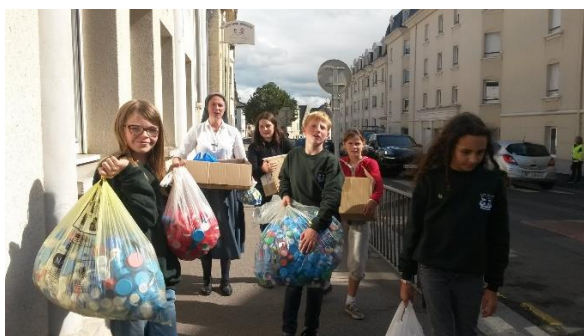
la collecte de bouchons de St e Bernadette