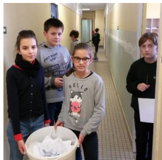
tour des classes