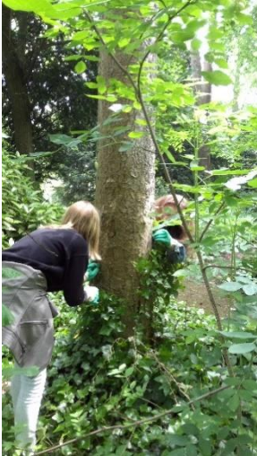
Soin du parc

Prendre soin du parc, aider à déménager des choses pour le collège, participer à la décoration, illuminer l'établissement le 21 décembre, rendre service très bientôt à l'occasion de la fête de Sainte Angèle en communauté... La joie du service, ce n'est pas que dans les choses exceptionnelles ! Cela dit, les illuminations avaient quelque chose d'exceptionnel : dîner et nuit en communauté, lever à 5h30, installation de lumignons et de torches pour accueillir élèves et adultes dès 7h30 !!!