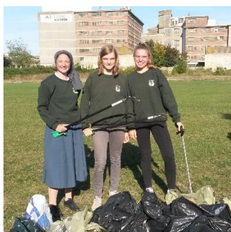
World CleanUp Day

Participation au World CleanUp Day, recyclages du papier, des bouchons, des instruments d'écriture, colles, emballages divers et réalisation d'un hôtel à insecte que nous mettrons dans le parc.