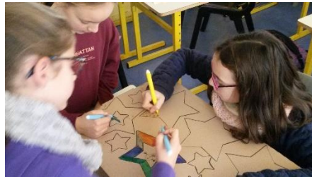
décorations de Noël