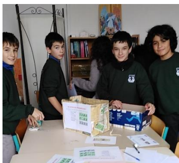
Réalisation des boîtes